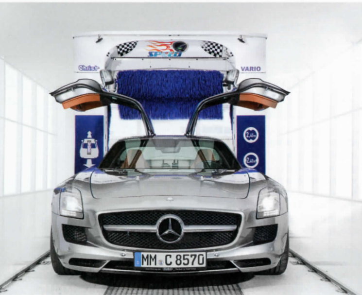
Ein Feuerwerk an Innovationen erwartet die Besucher am Christ-Messestand: im Bild die Portalwaschanlage Centus C164 Vario Speed

Waschstraßensysteme, SB-Waschplatz-techniken, digitale Bezahlssysteme, sensationelles Design und Technik zum Anfassen und Begreifen. Und auch Lösungen werden vorgestellt, die den geschäftlichen Erfolg des Investors nachhaltig sichern. Gerade kundenorientierte und kundenfreundliche Konzepte und Weiterentwicklungen der Anlagen und Technologien sind Christ wichtig.